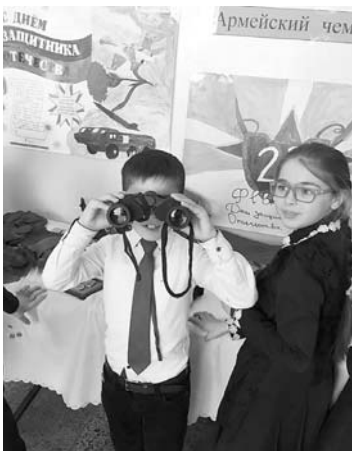
героев делились и педагоги, и обычные горожане, узнавшие об акции.

И в предметах из чемоданчика. Из собранных чемоданчиков во многих школах и центрах дополнительного образования выстроились целые экспозиции, ярко иллюстрирующие военный быт и все, что дорого сердцу солдата. На некоторых из них можно было даже примерить форму, подержать в руках автомат Калашникова и ощутить холод металла настоящих орденов и медалей. Кстати, наполняли чемоданчики не только школьники. Предметами своих