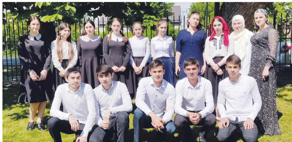
МБОУ «СОШ им.Дж.Х.Яндиева» , с. Дачное