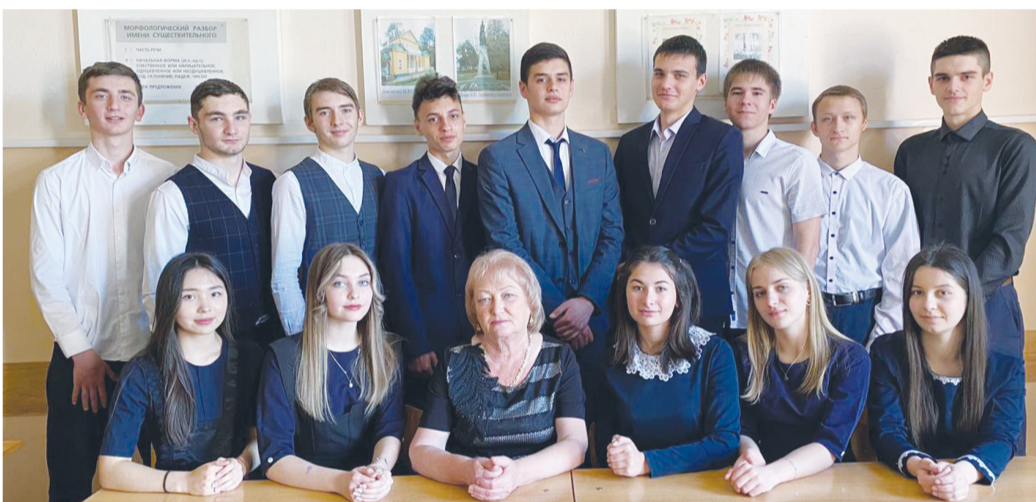
МБОУ «СОШ №1» ст.Архонской, 11 «Б» класс