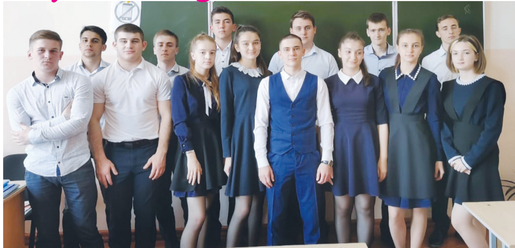
МБОУ «СОШ №1» ст.Архонской, 11 «А» класс