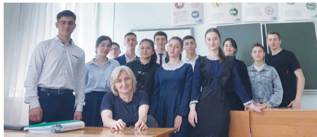
11 класс МБОУ «СОШ № 2 им. Д.Доева» с. Гизели