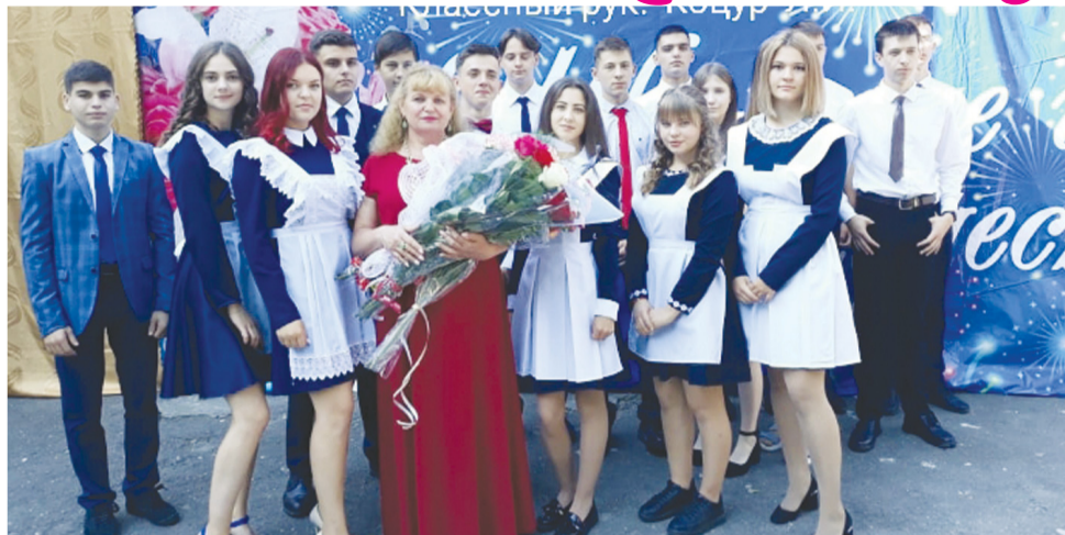
11 класс МБОУ «СОШ №2 ст.Архонской»