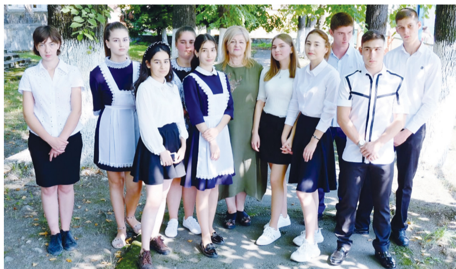
МБОУ «СОШ 1» им. А. Коцоева с. Гизели, 11 класс