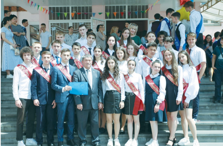
11 «А» класс МБОУ «Лицей»