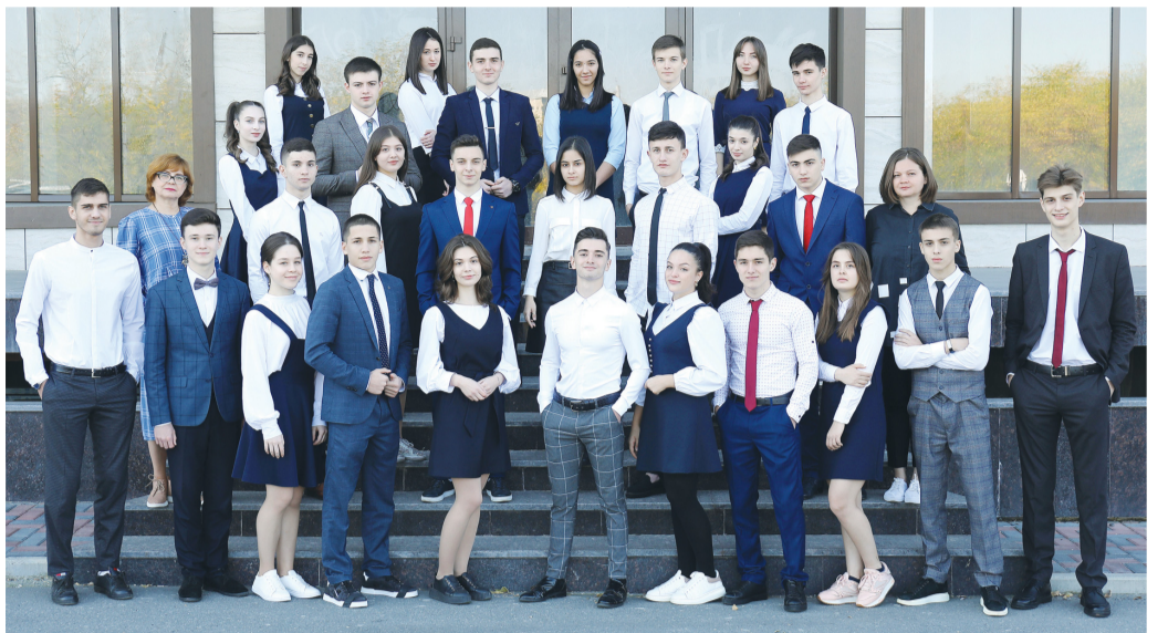
11 «Б» класс МБОУ «Лицей»