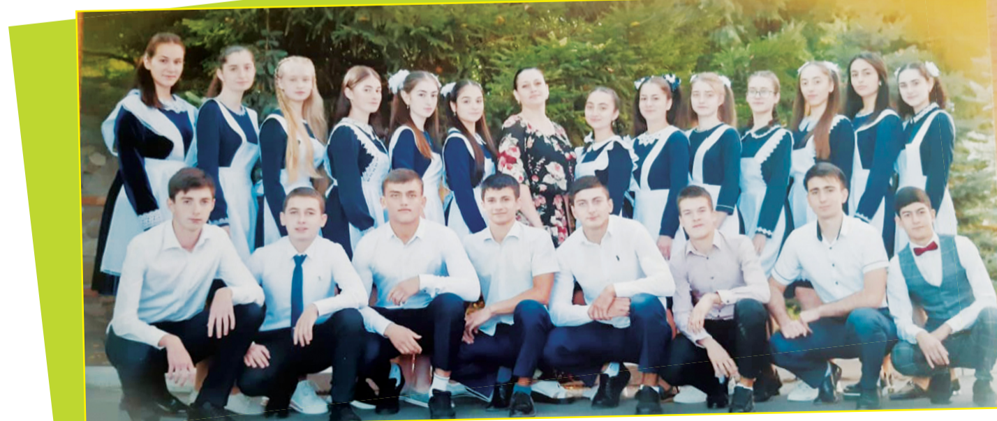
11 класс МБОУ «СОШ №1 им. заслуженного учителя РФ А.А.Агаева» с. Камбилеевского