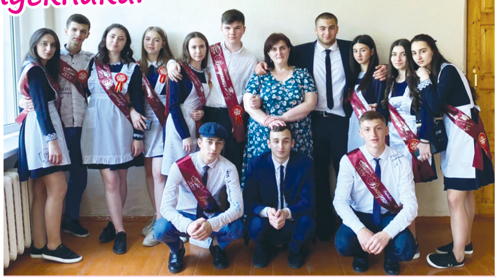
Выпускники 11 «Б» класса СОШ №22