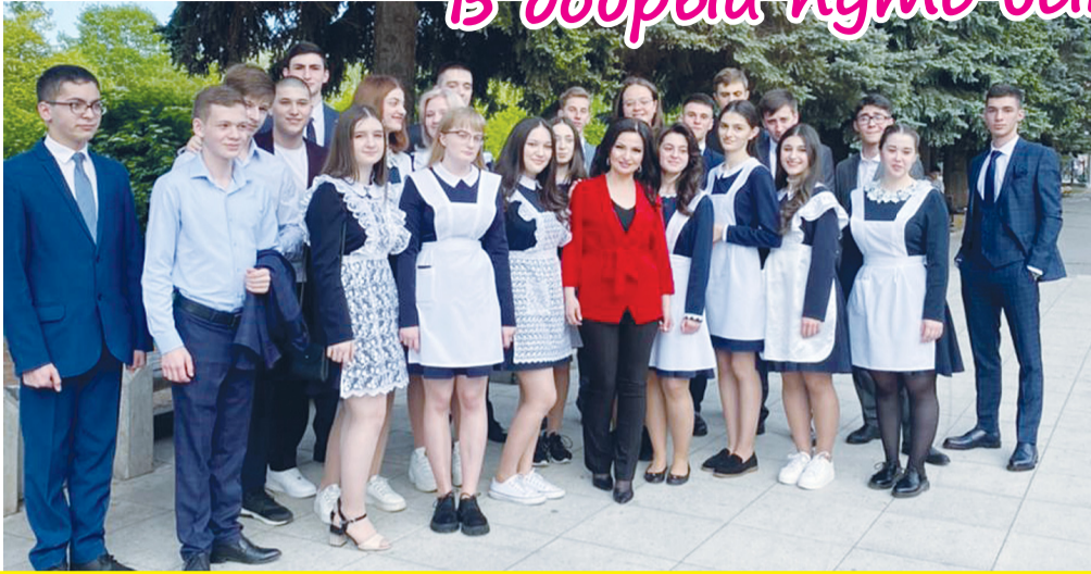
Выпускники 11 «А» класса СОШ №22