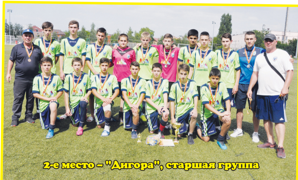
2-е место – "Дигора", старшая группа