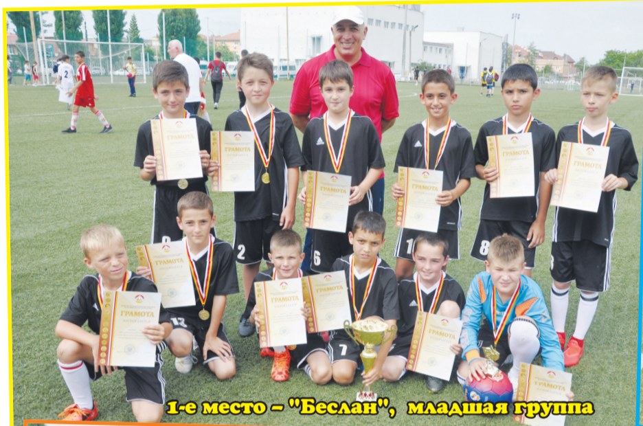
1-е место – «Беслан», младшая группа