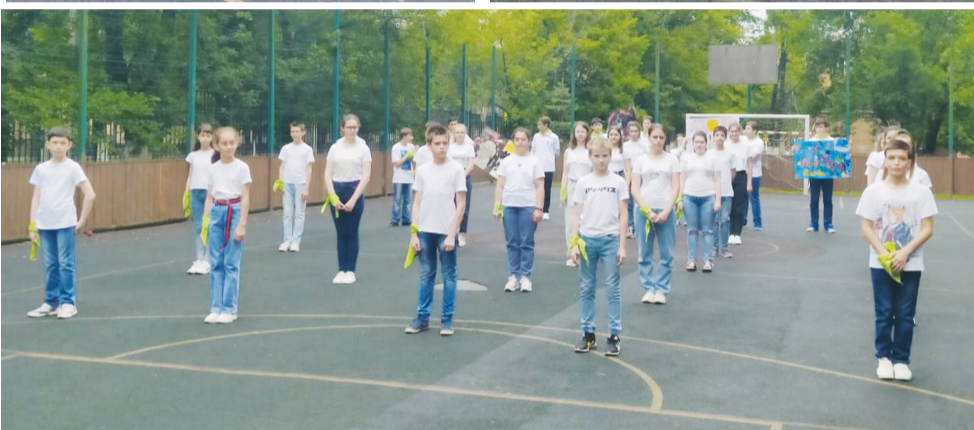
В канун международного дня борьбы с наркоманией и незаконным оборотом наркотиков в Республиканском физико-математическом лицее-интернате прошел флешмоб «Я говорю наркотикам «НЕТ!» в рамках антинаркотического месячника. Инициатором данного мероприятия стало Министерство образования и науки РСО-А.