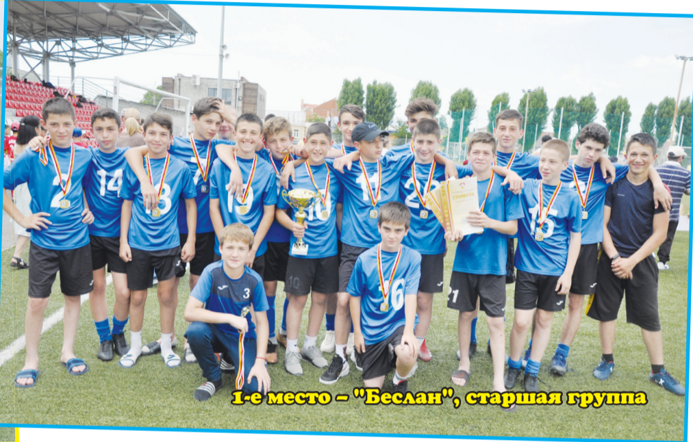
1-е место – «Беслан», старшая группа