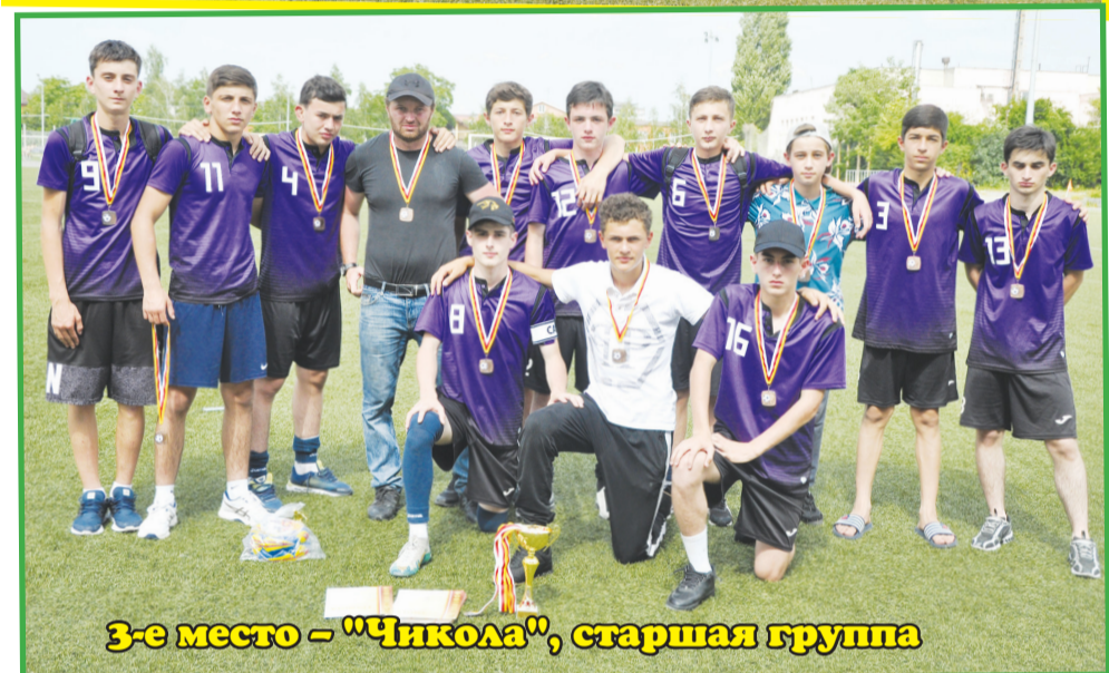
3-е место – "Чикола", старшая группа