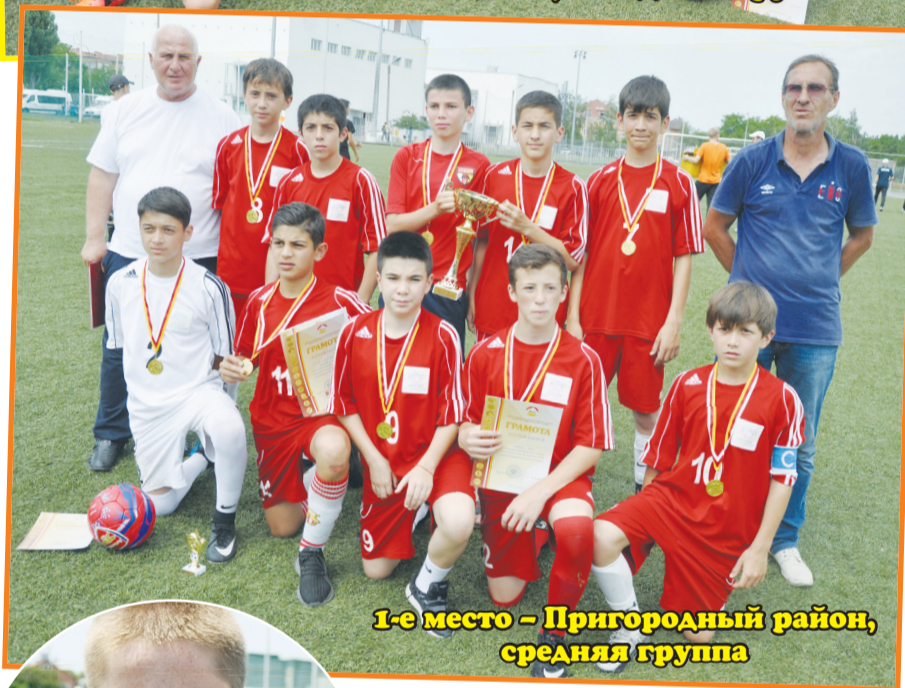
1-е место – Пригородный район, средняя группа

Вместе с чемпионатом мира, который проводится в этом году и в нашей стране, в частности, в городе Владикавказе 19 июня для юных любителей футбола стартовал турнир «Кожаный мяч-2021».