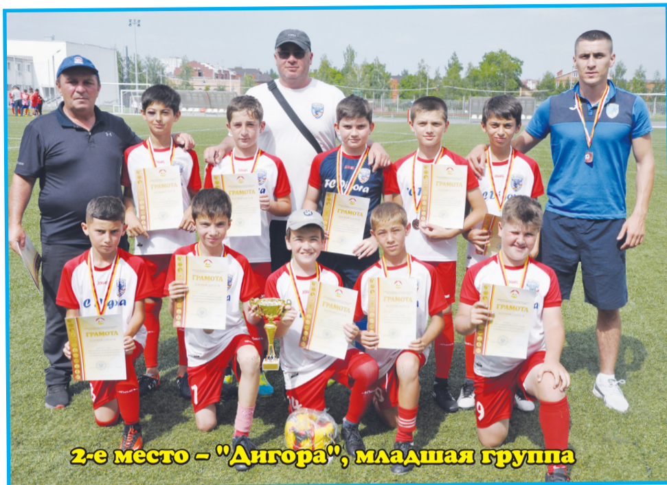
2-е место – "Дигора", младшая группа