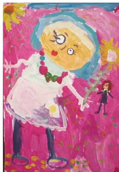
Чельдиева Алла, 5 лет, "Модная мама"