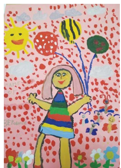
Токова Вероника, 6 лет "Веселая мама"