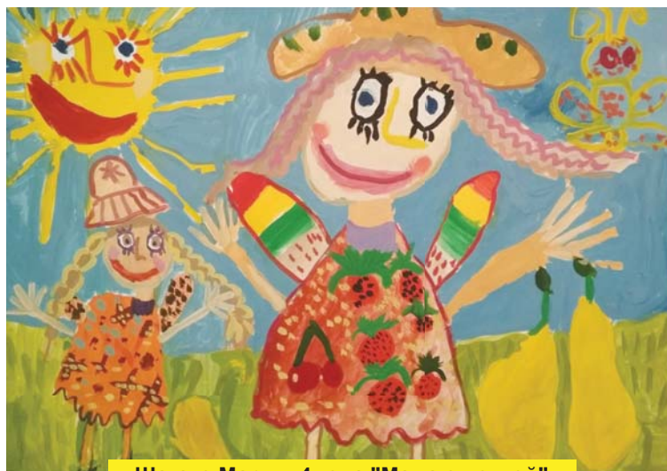
Шагако Мария, 4 года "Мама с дочкой"