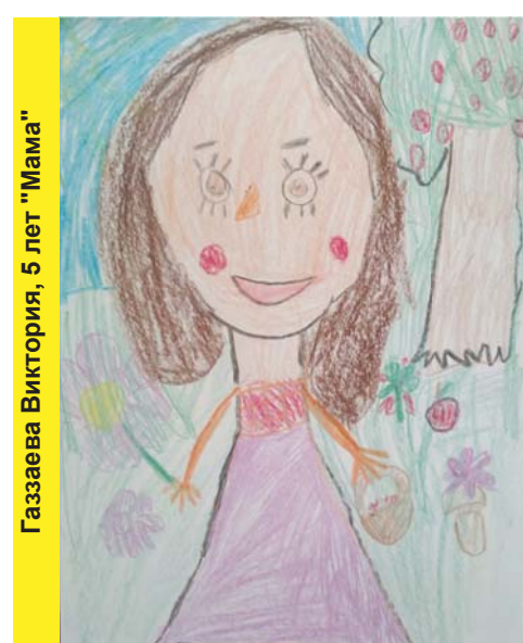
Газаева Виктория, 5 лет "Мама"