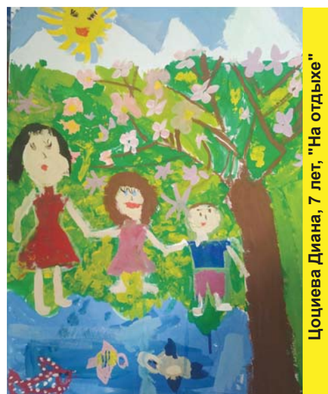
Цоциева Диана, 7 лет, "На отдыхе"