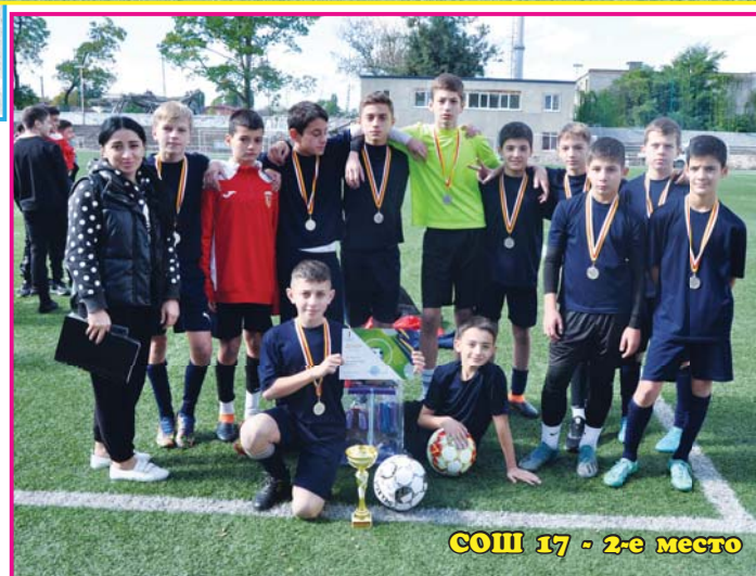
СОШ 17 - 2-е место