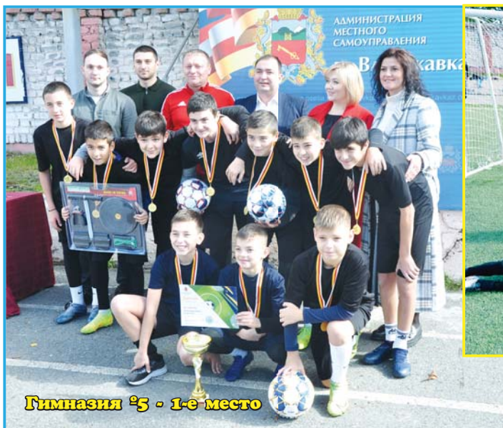
Гимназия №5 - 1-е место

Последний в этом году турнир по футболу среди мальчиков прошел на стадионе «Металлург» футбольного клуба «Барс». В этот раз играли команды мальчиков из городских школ.