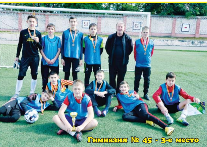
Гимназия №45 - 3-е место

— Мы продолжаем играть в баскетбол и волейбол. Но эти соревнования пройдут в рамках школьных игр.