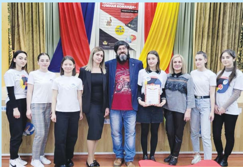
Районный этап федеральной интеллектуальной игры «Что? Где? Когда?»

В Доме детского творчества Пригородного района прошел районный этап федеральной интеллектуальной игры «Южный ветер» в формате игры «Что? Где? Когда?». Организаторы конкурса – республиканский интеллектуальный клуб «Альбус», Управление образования Пригородного района и ДДТ. В игре приняли участие 7 команд из СОШ Пригородного района: с.Ир – команда «Ир», с. Михайловское – «Евреи», №1 с. Октябрьское – «Стремление», №1 с. Камбилеевское – «Умницы», с. Сунжа – «Хищники», №2 ст. Архонская – «Люди в черном», №2, с. Октябрьское – «Рыцари».