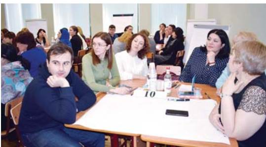
Министерство образования и науки РСО – А